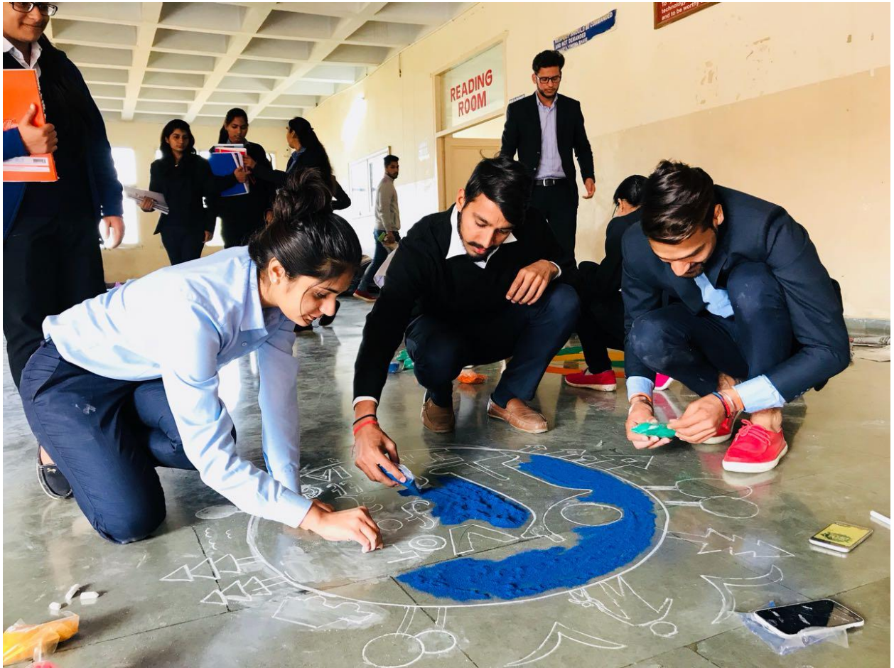
Poster Making Competition: