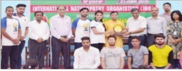
योग कार्यक्रम में हिस्सा लेते बच्चे व अन्य।