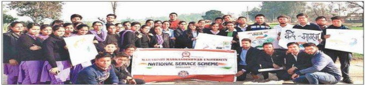
एमएम यूनिवर्सिटी में मतदाता दिवस पर आयोजित कार्यक्रम में भाग लेते विद्यार्थी। अमर उजाला