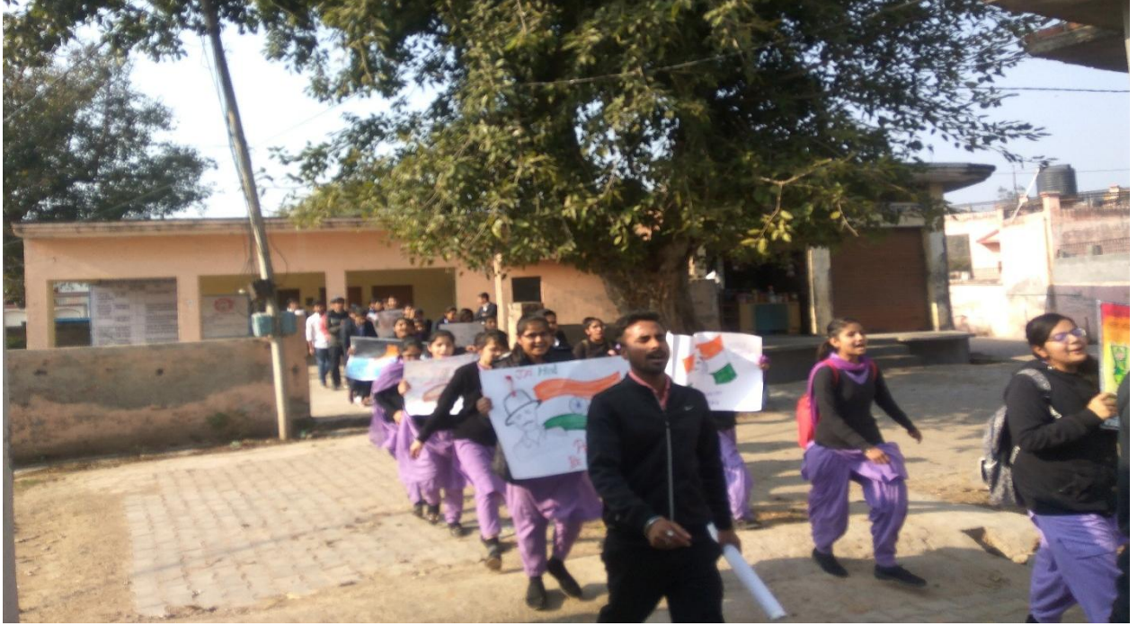
News Coverage on Voter's Day (25-01-2018)